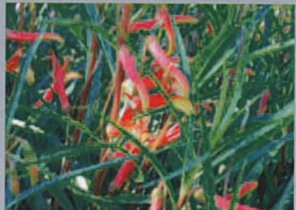
Exemple de plante vivace peu gourmande en eau : la Labellia laxiflora

En cas de sécheresse, les restrictions imposées par la préfecture concerneront prioritairement l'arrosage des jardins qui ne constitue pas un usage vital. Mieux vaut anticiper ces désagréments en effectuant, dès la création du jardin, un choix pertinent de végétaux.