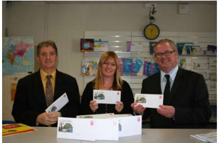
Une manière originale de valoriser vos correspondances !

Ces enveloppes sont en vente au tabac presse Daudel ainsi qu'au bureau de poste de la ville.