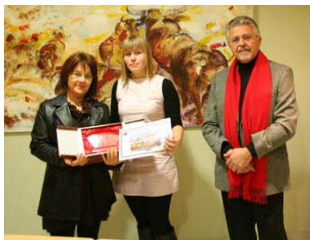
Chaque participant a reçu le trophée de la ville

Brillante initiative soutenue par la commune