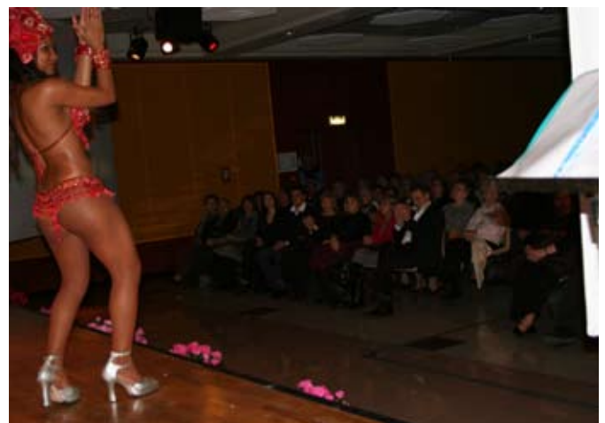
Deux écrans géants disposés de chaque côté de la scène retransmettaient l'allocution de M. le Maire en simultanée.