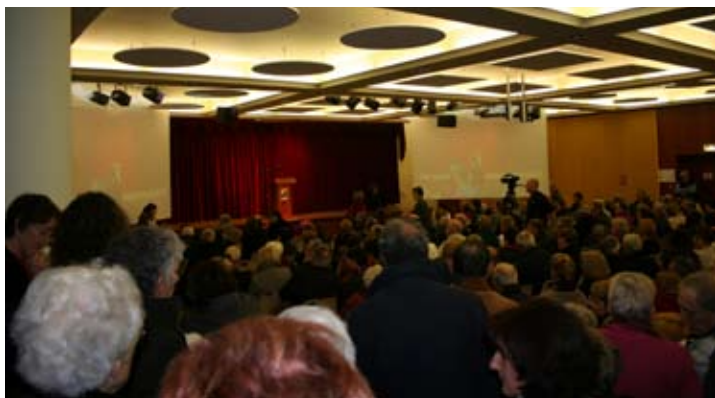
Pendant l'accueil des personnalités et administrés, un spectacle a fait patienter les invités déjà installés.