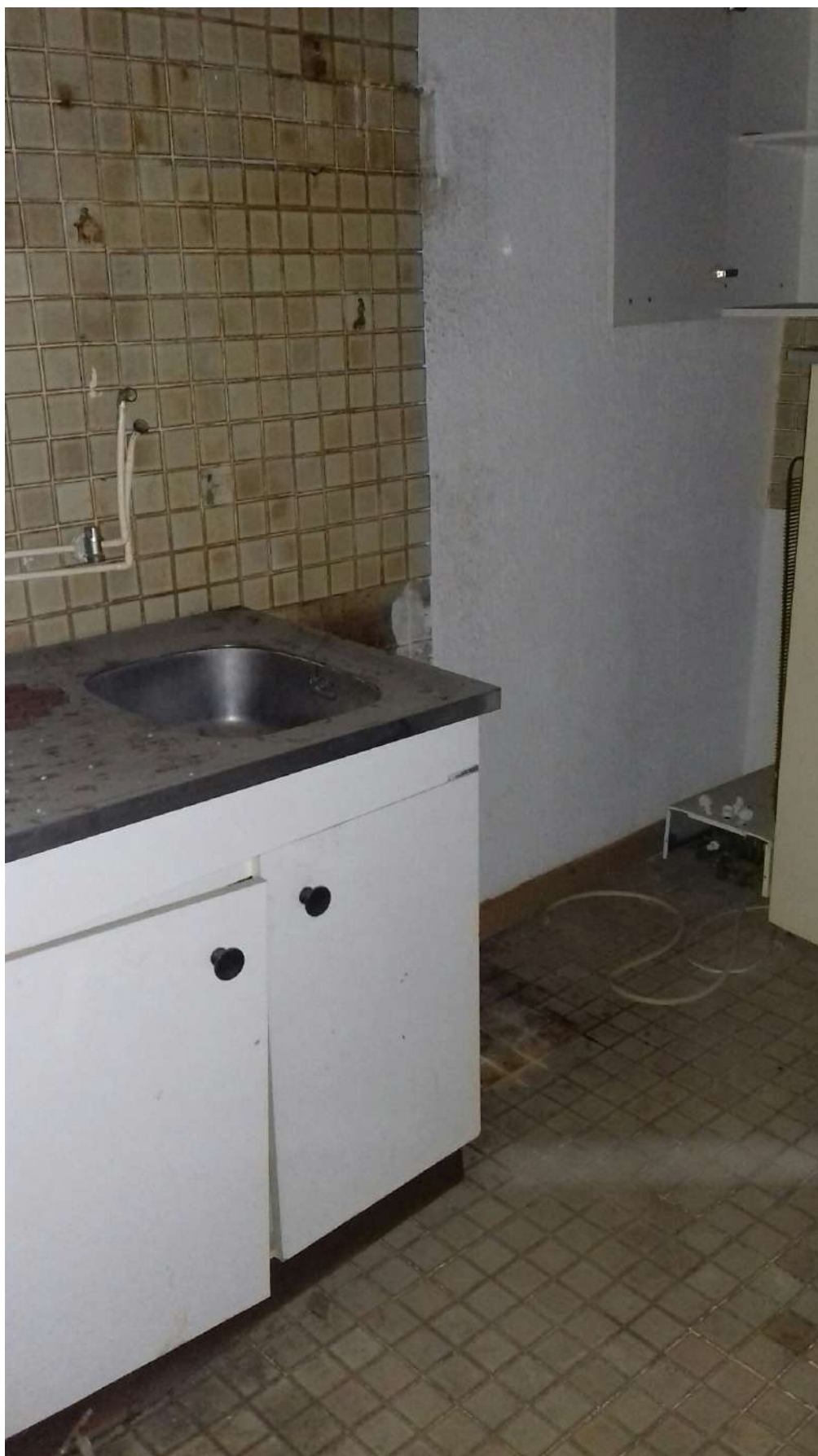
Cuisine au 1 er étage