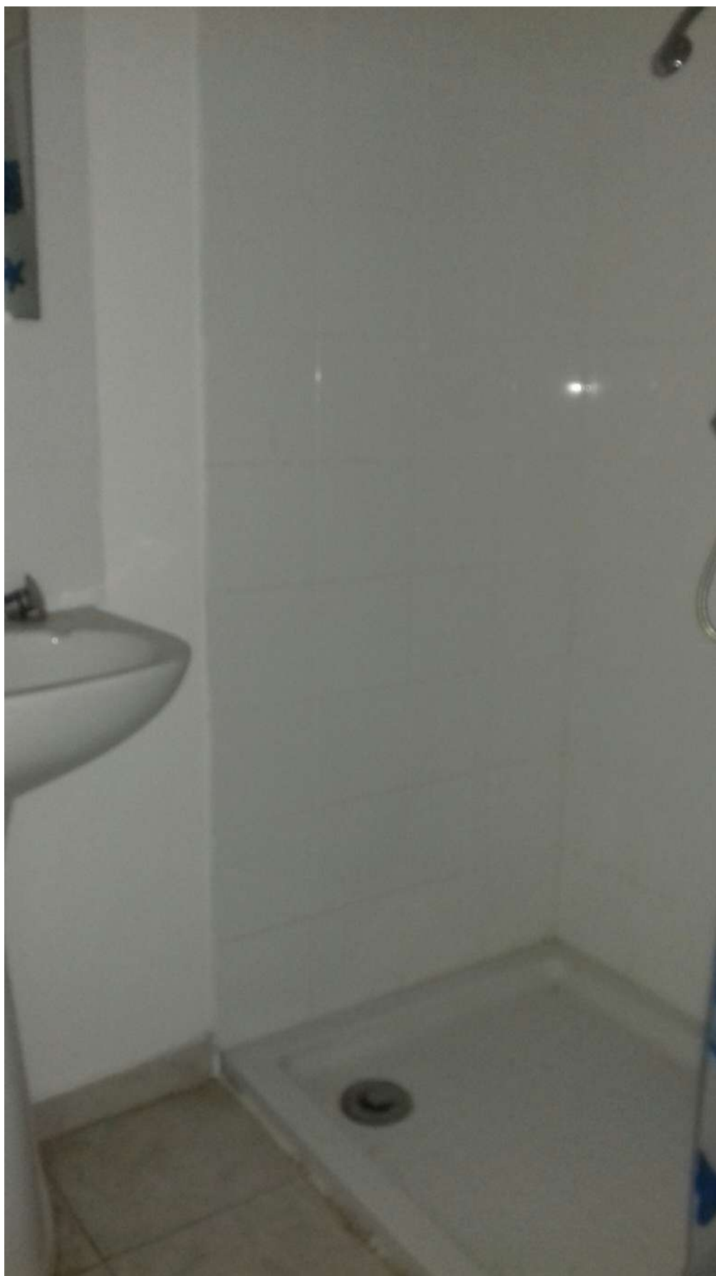
Salle de bains (au rez-de-chaussée)