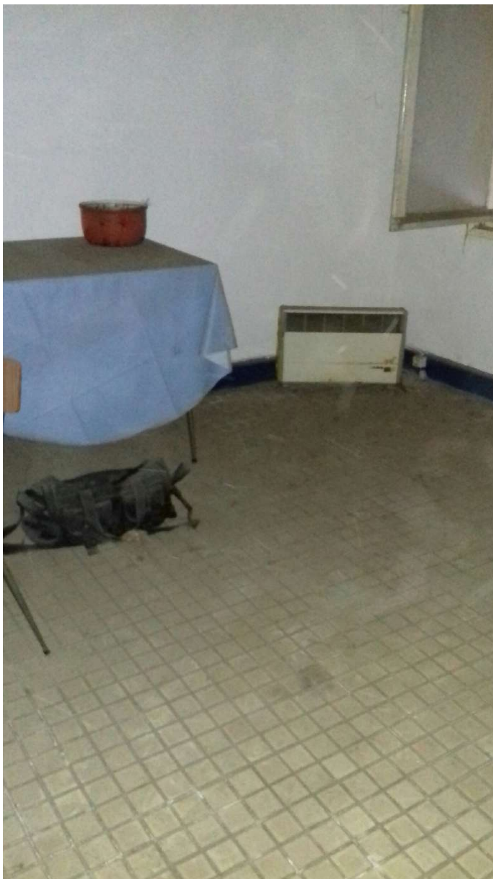
Séjour - 1 er étage