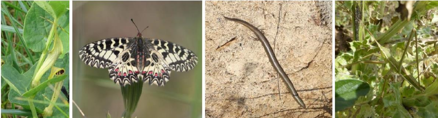
De gauche à droite, sur site : Aristolochie à nervures peu nombreuses ; Diane ; Seps strié ; Magicienne dentelée – CBE, 2021